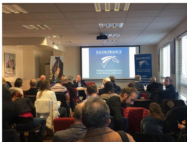
1 Le Comité a présenté son rapport moral et financier devant 65 personnes

Des actions ont également été menées en faveur des publics spécifiques et plus particulièrement en faveur