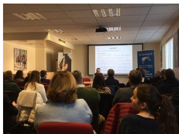
1 Intervention du GHN

Le 17 décembre, l'Assemblée Générale Ordinaire du Comité Régional d'Équitation d'Ile-de-France s'est tenue, à Boulogne-Billancourt (92), en présence de 70 personnes, élus, dirigeants de clubs et acteurs de la vie sportive régionale.