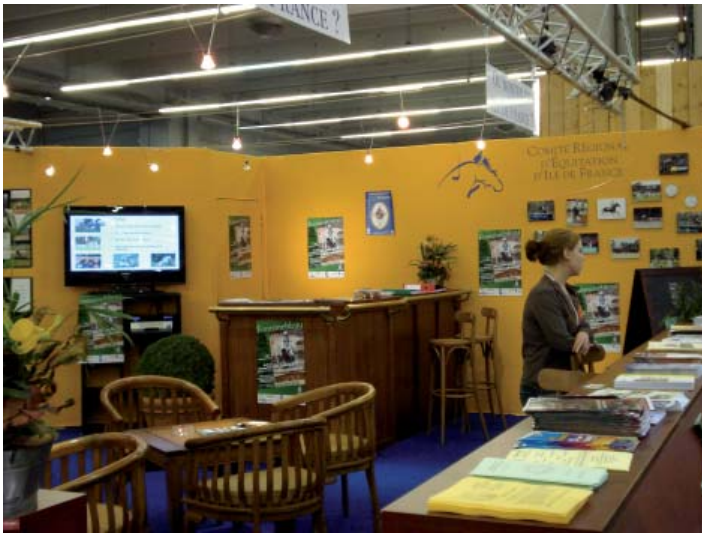
le stand du CREIF relooké

Cette année encore, l'accent a été mis sur la convivialité